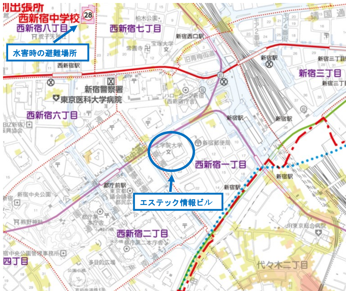
新宿区洪水ハザードマップ (2025.8 作成 抜粋)